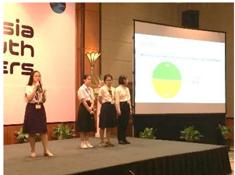
↑Bチーム 「大人と子供の食生活を改革するには」