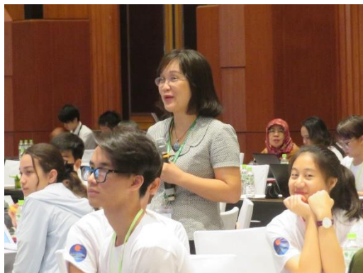
高校生と目線を同じくしての説明