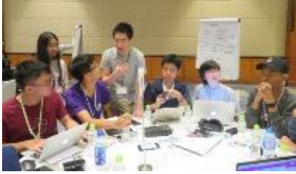
過去参加者がメンターとして議論をサポート