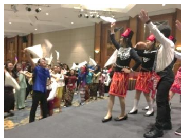
ミャンマーチーム