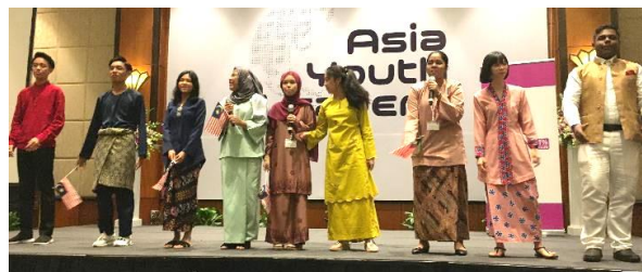
マレーシアチーム