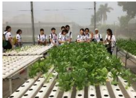
ほうれん草の栽培方法の視察