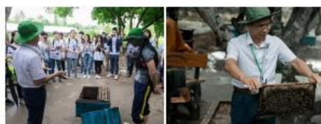
The students visit the Research Center for Tropical Bees and Beekeeping.