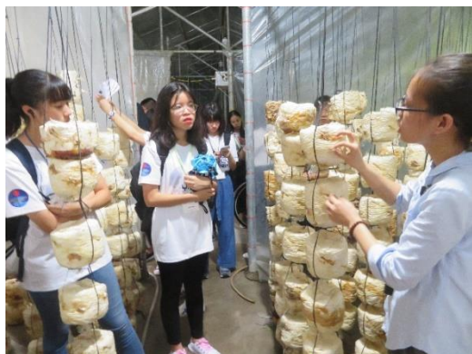
キノコの研究についての視察