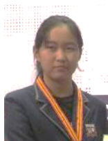
Tianjin Xinhua High school 生徒代表

↑ 1位のチームリーダーから成果発表を引き継ぐアジアユースリーダーズホスト国のベトナム高校生代表