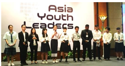
↑Eチーム 「飲料および朝食に関する栄養問題の解決策」