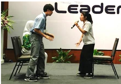
↑Cチーム 「健康な食生活のためにはどうすれば良いか」