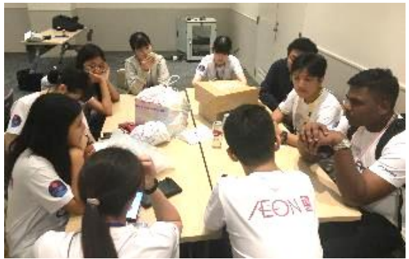
インタビュー後の意見のまとめをする各国高校生