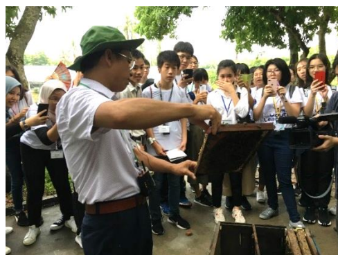
ミツバチの研究についての説明