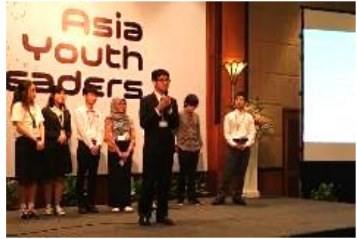
↑Hチーム 「より健康な食事を目指した運動」