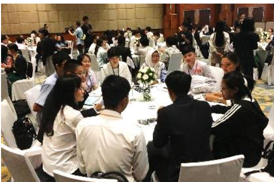
↑ 初めて会ったチームメンバーとお互い自己紹介