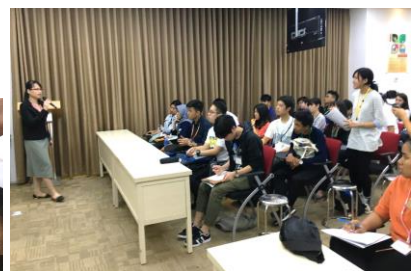
↑ 講師に質問するカンボジア高校生