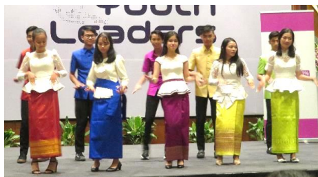
カンボジアチーム