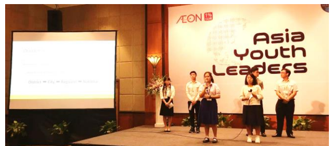
↑Jチーム 「ベトナムの人々の食習慣向上」