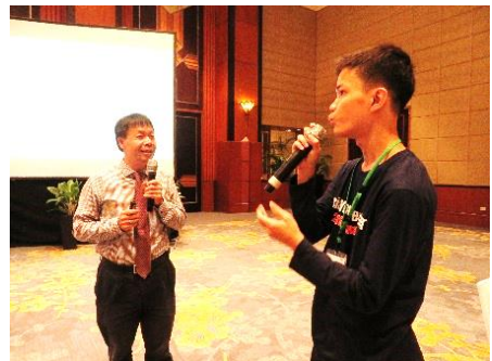
質問をするインドネシア高校生