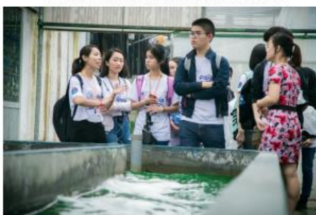
The students visit the institute of Research and Development of Microalgae.