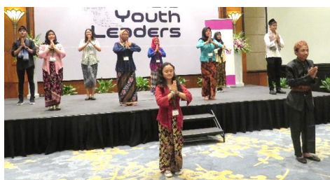
インドネシアチーム