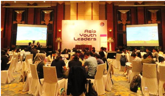
大画面を活用した講義