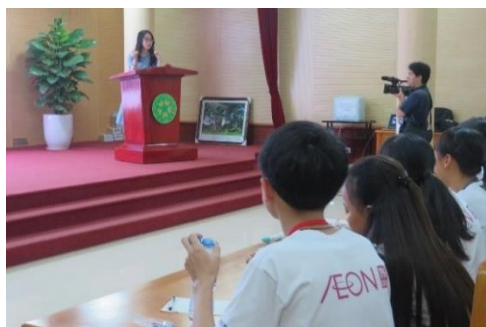
ベトナム国家農業大学についての説明