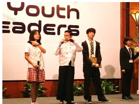
↑Dチーム 「不均衡な毎日の食事」