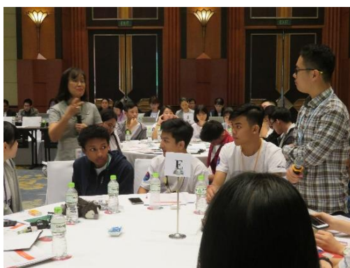
質問をする中国高校生