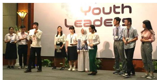
↑Fチーム 「ダイエット for ユー」