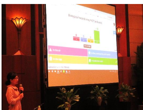
ネットのクイズを活用した講義