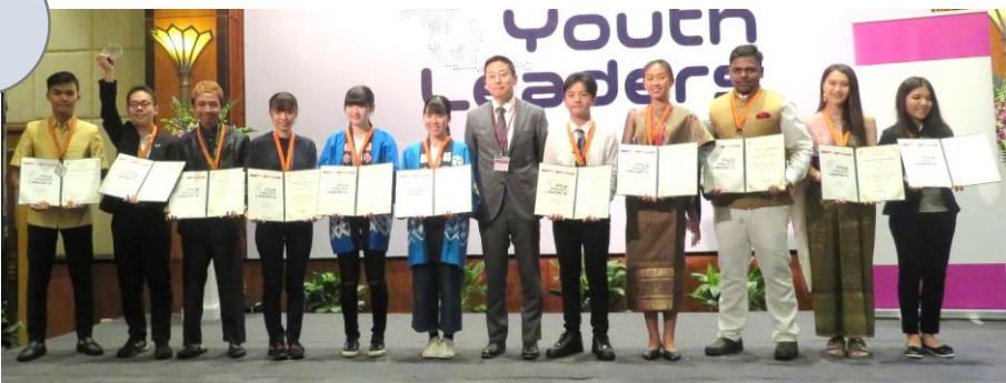
イオンベトナム石川北部代表と記念撮影をする第2位のEチームメンバー