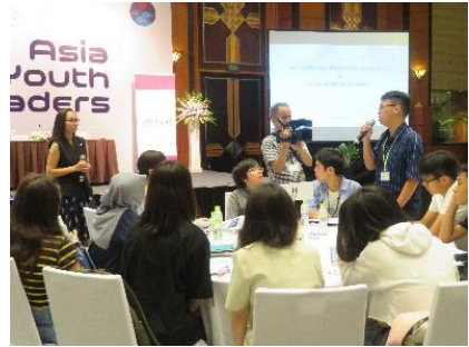
質問をするベトナム高校生