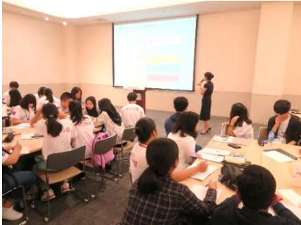
イオンモールについての講義