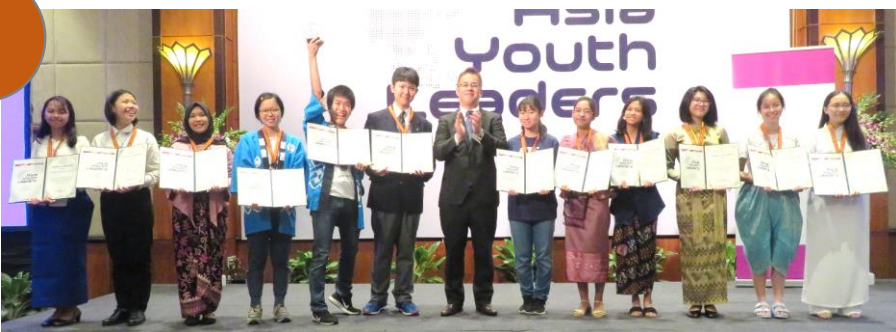
ACSTレーディングベトナム新谷会長と記念撮影をする第3位のBチームメンバー