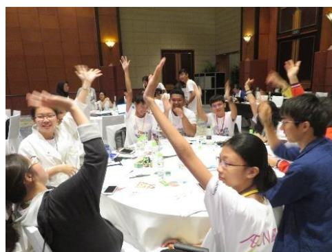
質問のため挙手する各国高校生