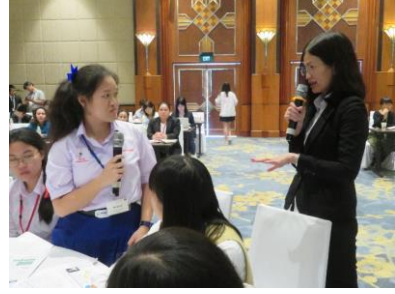
質問をするタイ高校生