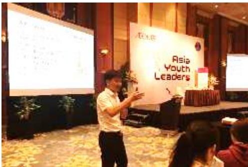
子供の栄養摂取課題の説明の様子