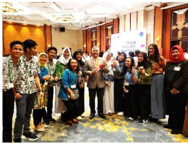
↑インドネシアチーム