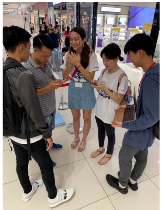
それぞれのプレゼンに向けた質問を聞いていく各国高校生たち