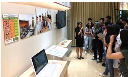
↑ 給食プロジェクトについて話を聴く各国高校生