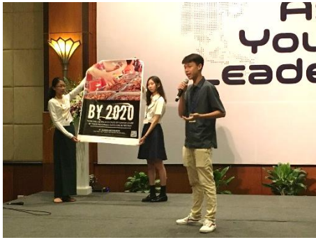
↑Gチーム 「オーマイゴット、私の体に何が起きてるの？」