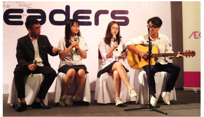
↑歓迎パフォーマンスを披露するベトナム高校生↑