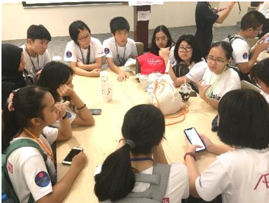
インタビュー前にチームごとに打ち合わせ