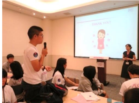
質問をするタイ高校生