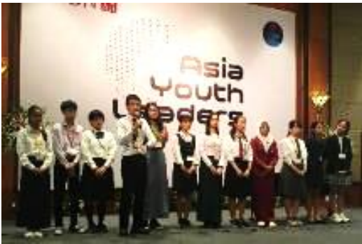
↑Aチーム 「ベトナムにおける健康な食生活と栄養教育の問題」