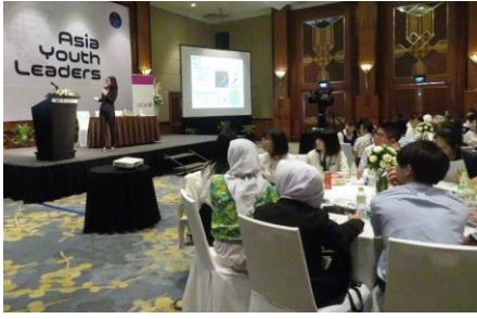
集中して講義を聞く各国高校生