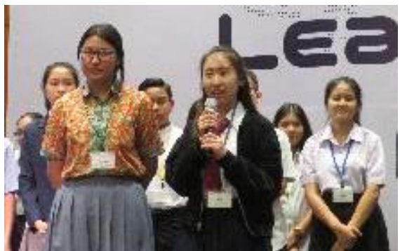
↑ チームリーダーを決めチームの意気込みを発表