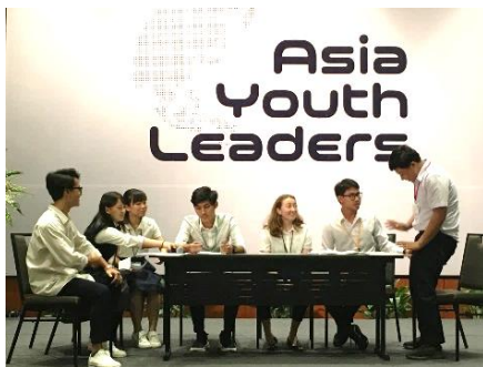
↑Iチーム 「健康の剥奪（ストリートフード）」