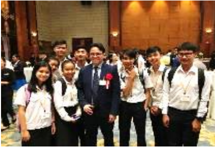
↑カンボジアチーム