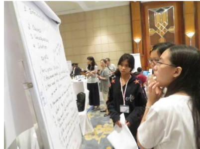
議論をまとめる各国高校生