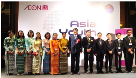
↑ミャンマーチーム